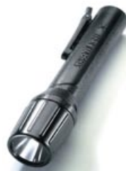
3C Luxeon LED

Hochleistungslampe mit LED-Modul oder Luxeon-Hochleistungs-LED. Gehäuse aus schlagfestem Kunststoff. Mit Endkappenschalter für Momentlicht sowie Dauerlicht. Wasserdicht bis 60 Meter. Batterien sind nicht im Lieferumfang dabei. Auch in Ex-Schutz-Ausführung erhältlich