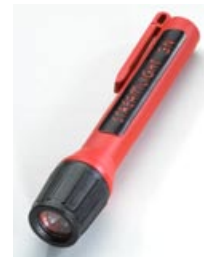
ATEX 3N LED