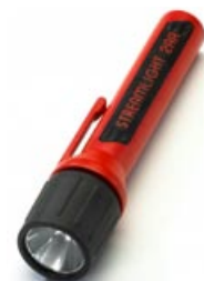
ATEX 2AA Xenon