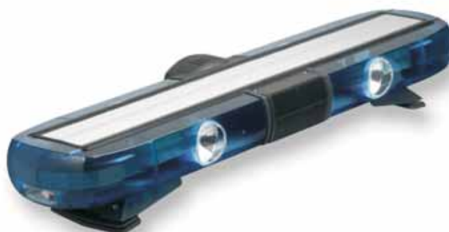
Lichtbalke modellreihe Sputnik Phoenix