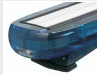
Hauptsignalisierung LED's Sputnik

AS-250 100W Sirenenverstärker, (Tonfolgen: Zweiton, Wail und Yelp), ohne Mikrofon.